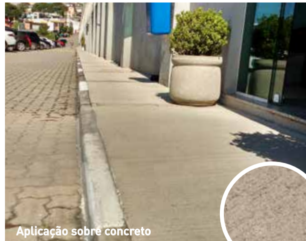
Aplicação sobre concreto

Devido sua excelente aderência aos pavimentos de concretos e betuminosos, ótima durabilidade e alta resistência ao intemperismo o DUR-A-LAN torna-se o produto ideal para demarcação de rodovias e vias urbanas.