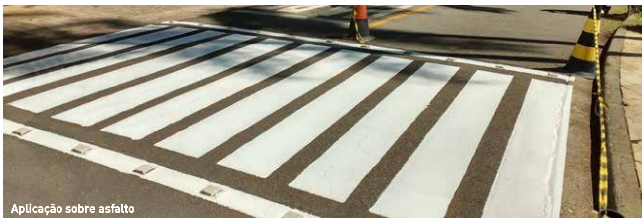
Aplicação sobre asfalto