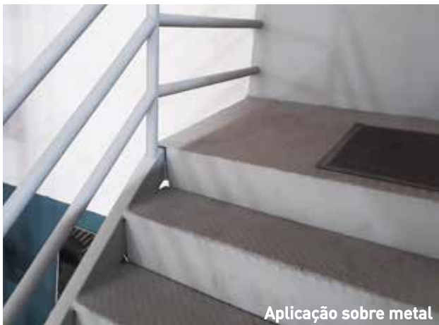
Aplicação sobre metal

Baixa espessura mantém a textura da base