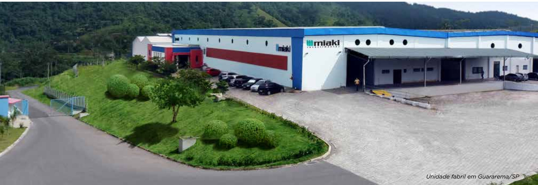
Unidade fabril em Guararema/SP

A Miaki Revestimentos é uma indústria e comércio de resinas para revestimentos monolíticos de alto desempenho. Atua no mercado de revestimentos desde 1993 com sistemas para áreas industriais, comerciais e residenciais. Com duas unidades, a empresa possui uma fábrica na cidade de Guararema, interior de São Paulo, e sua sede administrativa juntamente com o CDT (Centro de Desenvolvimento Tecnológico) estão localizadas em São Bernardo do Campo, na grande São Paulo.