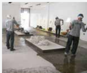
Aplicação do primer