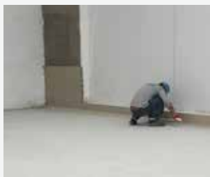
Preparação da superfície