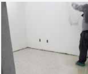
Aspersão dos flakes

Em menos de 12 horas executamos um piso à altura de suas necessidades e expectativas, que podem prolongar-se por décadas.