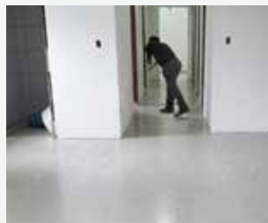
Aplicação do acabamento